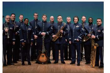
榛名文化会館は、米国空軍太平洋音楽隊に所属するジャズ専門のビッグバンド「パシフィック・ショーケース」の演奏会

を開催します。おなじみの名曲や即興演奏など、本場の演奏でジャズをお楽しみください。