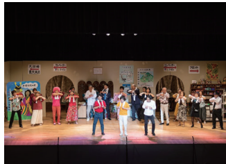
前作の公演の様子

市民演劇は、公募で集まった市民による演劇です。今回は、昨年の市民演劇で舞台となった温泉宿「令和館」の5年後を描く、同演劇初となる続編公演です。