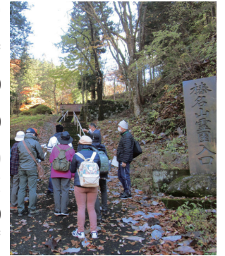
景色も楽しみながら

●日時 10月20日(金)午前10時～正午 ●集合場所 榛名歴史民俗資料館 ●内容 ガイドの案内で、普段見ることのできない榛名神社周辺の史跡を歩いて巡る ●定員 先着20人 ●費用 無料 ●申し込み 10月11日(水)までに、電話で榛名歴史民俗資料館(☎027・374・9761)へ