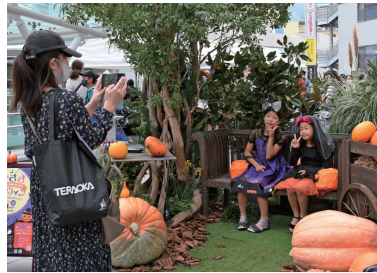
昨年のイベントの様子

高崎駅西口ペデストリアンデッキなどを会場に「たかさきハロウィン」を開催します。お菓子がもらえるスタンプラリーや、プロのメイクアップアーティストによるハロウィン仮装メイクパフォーマンスショーの他、子ども向けのメイクコーナーや