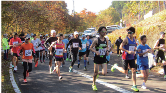
自然の中で己の体力を試す

烏川溪谷ロードレース大会実行委員会と市は、11月3日(祝)に開催する「烏川溪谷ロードレース大会」の参加者を募集します。コースは、標高840mにあるはまゆう山荘周辺。紅葉する豊かな自然が舞台のマラソン大会です。秋の倉淵を思い切り駆け抜けてみませんか。