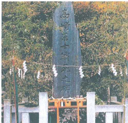
下仁田戦場跡「高崎藩士戦士之碑」