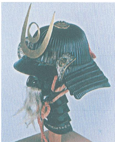
左：堤金之丞 血染めの兜