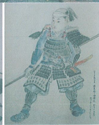
上：戦死者絵巻の一部 下：田村堂安置木像の一部