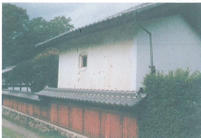
高崎藩本陣「里見邸」土蔵の弾丸跡