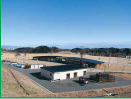
3 観音山ファミリーパーク眺望