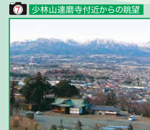
7 少林山達磨寺付近からの眺望