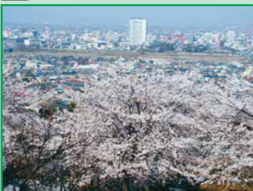
5 観音山駐車場からの眺望