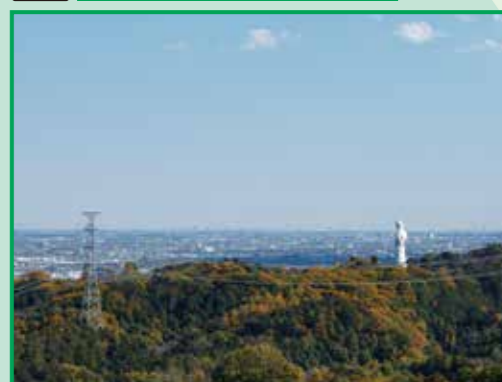
6 寺崎牧場付近からの眺望