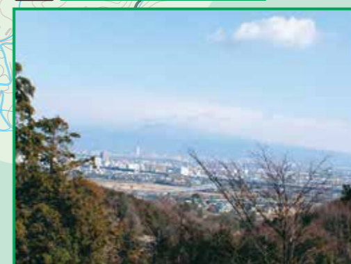
2 寺尾中城址からの眺望