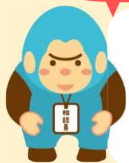
群馬県福祉人材センター マスコットキャラクター

●事前に予約されると当日の手続きがスムーズです、 事前予約された方には来場時に粗品をプレゼント！