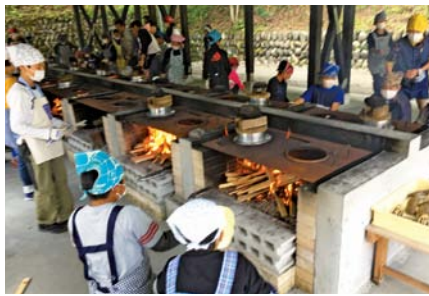
榎名林間学校の様子(車郷小)

シャトルバスを用意する必要があるため、国際大会や各種大会などのイベント誘致に寄与できている。また、普段の日もアリーナの利用