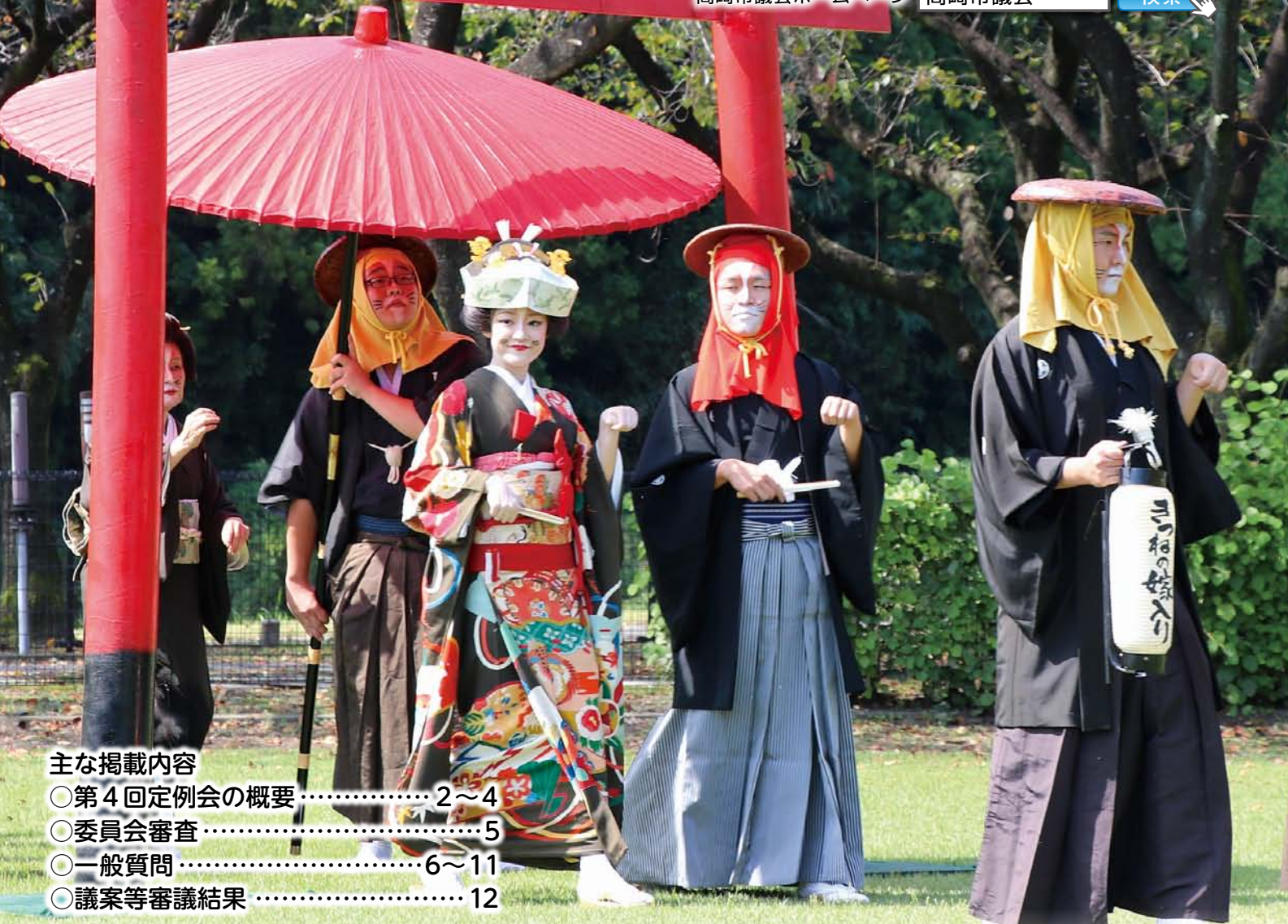
きつねの嫁入りの花嫁行列