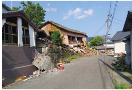
熊本地震で倒壊した家屋と崩れた壁