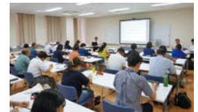
市民後見人養成講座

答弁 平成24年度に27人、28年度に26人、合計53人の市民後見人を養成しているが、辞退もあり現在は37人となっている。養成後に研修を行っているが権利関係や財産の処分など専門性の高い案件も多いことから、実働している人数は5人である。