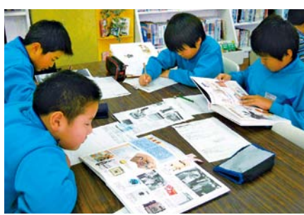
図書館を活用した調べ学習

答弁 各学校では、学校図書館での調べ学習等を積極的に進めるよう環境整備に努めている。学校図書館を活用し、自分に必要な本を探すとといった学習に対する