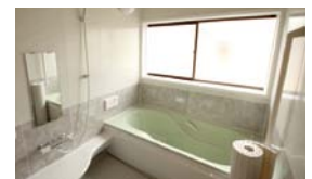
リフォーム後の浴室