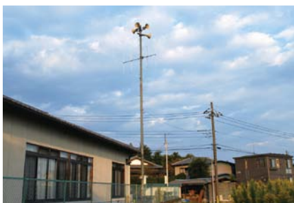
箕郷地域にある防災行政無線

質問 災害など緊急時に危険を知らせるには、防災行政無線が効果的と考えるが、現在の配置状況は。また、市全体を網羅できないか。