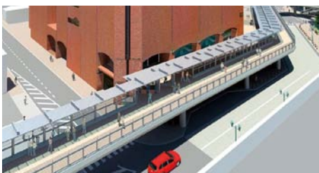
ペDESTリアンデッキ完成イメージ図