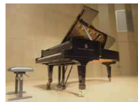
購入予定と同等のコンサートグランドピアノ