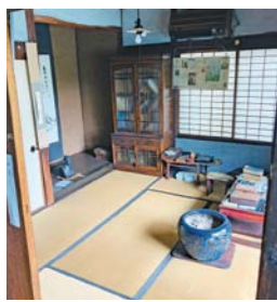
村上鬼城が過ごした書齋