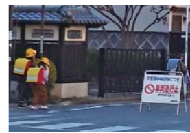
可動式バリケードの配備

1億3350万円 生活道路等の補修や通学路に車両の速度抑制を促す路面段差等の整備を行う。また、可動式バリケードを時間帯通行規制道路に配備し、児童や歩行者の安全を確保する。