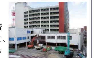
整備が進むスズラン周辺

答弁 令和3年度に補修設計が終了した環状大橋のほか、浜尻陸橋、城南橋の工事を実施する予定である。