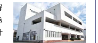
建て替える労使会館

答弁 令和4年6月までに基本設計を終え、速やかに実施設計と既存の労使会館の解体設計に着手する。順調に進めば、12月までに全ての設計が完了する予定である。