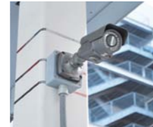
防犯カメラの設置で犯罪を抑止

答弁 令和3年度までに1,558台設置しており、令和4年度は200台を新設する予算を計上している。