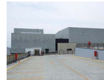
高崎芸術劇場の南面

答弁 高崎芸術劇場の存在を広く認知してもらえるよう、劇場の南面の最上部に館名サインを設置するものである。白地の壁に黒色で、高崎芸術劇場と漢字6文字で表記し、夜は館名サインを後ろから照らして白色発光して見える仕様である。