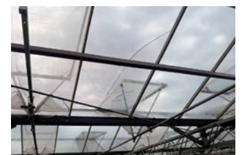
被害を受けた農業用ハウス

答弁 被災したハウスのガラスやビニール、防災網などは、指定された集積場所に搬入してもらえば、市が収集して処分する。また、直接高浜や吉井のクリーンセンター、新町のクリーンステーションに搬入されたものについても対応したい。