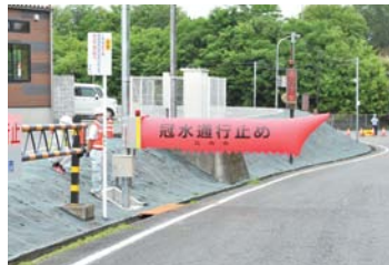
設置したエア遮断機

質疑 建設資材の不足や高騰により、市が発注している建設工事等に影響があると思うが、どのような状況か。