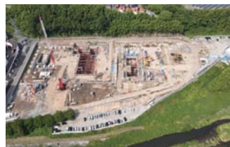
工事が進む高浜クリーンセンター

答弁 現在、新型コロナウイルスの感染拡大や世界的な社会情勢等により、国内外の経済はさまざまな影響を受けている。令和4年3月1日適用の労務単価および資材単価の上昇を受け、労務費や材料費等の急激な変動に対処するため、インフレスライドを適用したことで、工事費が増額した。