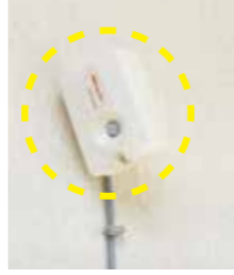
通報装置(上写真)と安否確認センサー(左写真)。センサーは多くの時間を過ごす居間の壁などに設置

小型GPS機器を無料で貸し出し、機器を携帯した高齢者が行方不明になった場合に位置を特定して、迅速な救援が可能です。