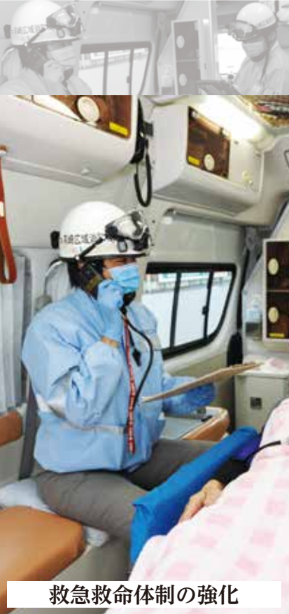
救急救命体制の強化

救急患者のたらい回し「ゼロ」を目指し、救急医療体制を強化しています。医師や空きベッドの不足などに対応するために医療機関への補助を実施。救命医が現場に出向くドクターカーの運行などにも支援しています。